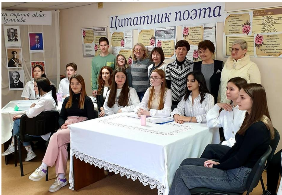
Фото № 5 Организаторы и участники литературной гостиной, 11 марта 2022 г. Филиал КубГУ, Геленджик

нужное всем. И пусть это станет ещё одной студенческой традицией, способной не только увлечь студентов интересным делом, но и помочь им сделать правильный выбор между книгой и компьютером, помочь им получить те чувства и эмоции, которые способны дать только настоящая поэзия и художественная литература.