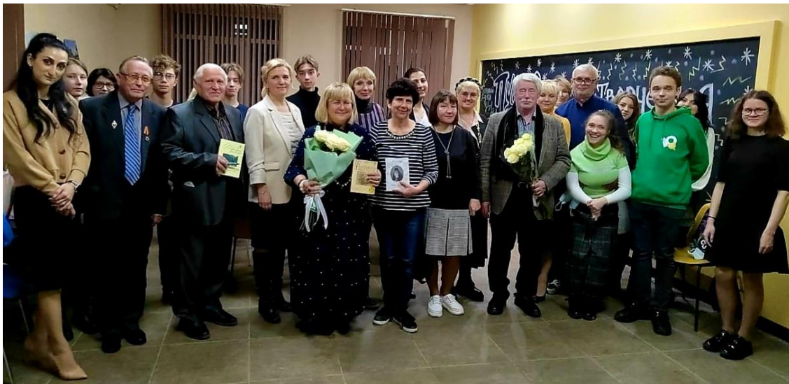
Фото № 1 Творческая встреча в молодёжном центре «Пульс», декабрь 2021 г.;